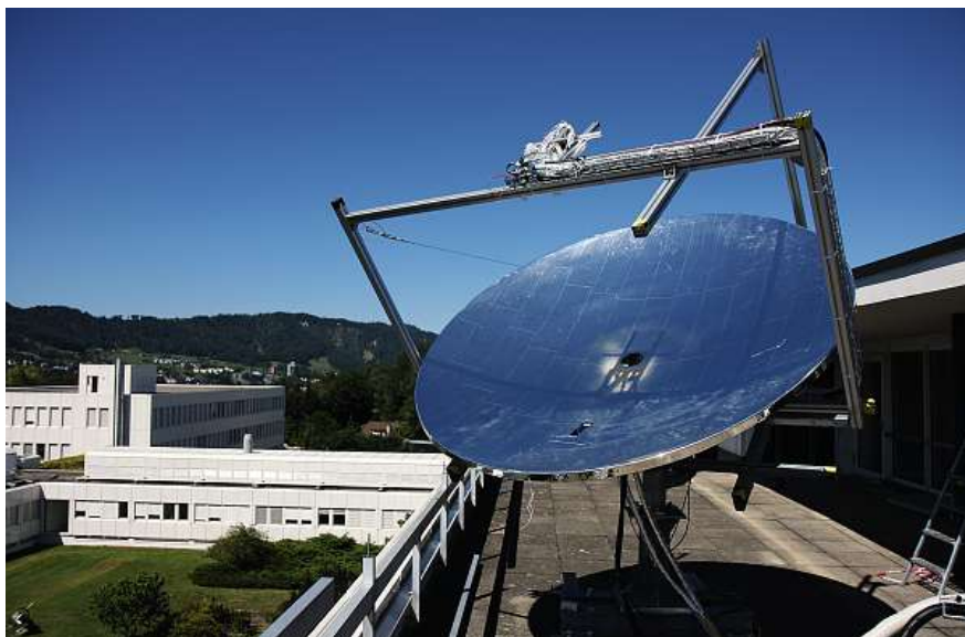
Bild 3 Das hochkonzentrierende Fotovoltaik-System (HPVC) von IBM ist ein Beispiel für ein informatikgestütztes Forschungsprojekt im Energiebereich.

■ Als Beispiel einer bereits eingeführten zukunftsorientierten Green-IT-Anwendung kann das Energieeffizienzprojekt von Microsoft angeführt werden. «30 000 Sensoren in 125 Gebäuden liefern binnen 24 Stunden 500 Millionen Datensätze unter anderem für Heizungen, Klimaanlage und Lampen, um diese gezielt ein- und auszuschalten», schreibt hierzu